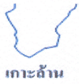
เกาะล้าน